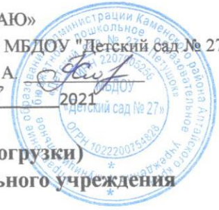
Схема путей движения транспортных средств к местам разгрузки (погрузки) и рекомендуемых безопасных путей продвижения по территории образовательного учреждения